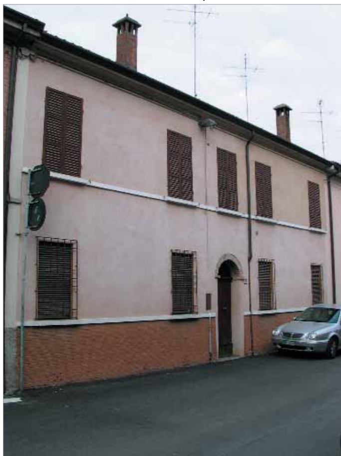
Via Berti 65 Fronte Principale